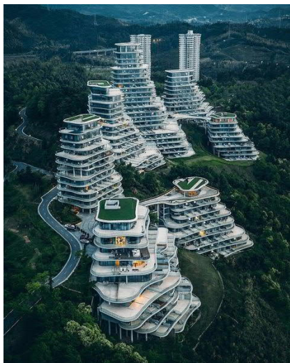
Рис. 4. Горная деревня Хуаньшань, бюро MAD 2017