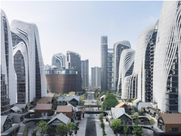
Рис. 3. Гималайский центр Зендай в Нанкине от бюро Ма Янсона MADArchitects

Успешный китайский архитектор Ма Янсон уверен, что современные города могут совмещать в себе природное начало и урбанистические идеи. В традиционной китайской культуре природа намного более значима, чем человек и его возможности восприятия городского пространства. Поэтому традиционное жилье (особенно народная, а не «нормативная архитектура») [Шевченко, Кошевец, 2024, с. 61] китайцев всегда гармонизировало с окружающим ландшафтом. В новейшем китайском градостроительстве пока доминируют привнесенные планировочные традиции модернистского города, базирующегося на стандартах западной архитектуры. Но прекрасно владеющий западной профессиональной традицией Ма Янсон все же считает, что в XXI в. нужно вернуть тенденцию к большей гармонии с природой, опираясь уже на новые технологические возможности и обновленное отношение к значимости работы с ландшафтом в городской среде. В своих новаторских природоориентированных проектах авторитетный китайский архитектор последовательно решает задачу вписывания новых построек в существующий пейзаж.