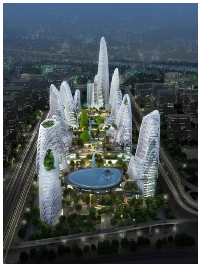
Рис. 5. Экспериментальный комплекс Шаньшуй, Шенчжень, 2013

Показательной иллюстрацией жизнеспособности такого подхода к созданию жилой среды выступает проект «Горная деревня Хуаньшань» (Huangshan Mountain Village, 2017). [Ма Янсонг ...]. Над проектированием и возведением этого комплекса бюро MAD трудилось около 8 лет. Проект формирует комплекс зданий на берегу искусственного озера Тайпин в горах Хуаньшань в Китае. Основу геометрии зданий составляют плавные линии – уровни, перетекающие из одного здания в другое. Все апартаменты Горной деревни Хуаньшань имеют широкие изогнутые балконы, повторяющие изгибы горной гряды. Ма Янсонг специально добивался эффекта слияния с окружающей природой гор и протяженностью рукотворного пространства вдоль водной глади. Данью уважения к национальным традициям архитектор называет обращение к образным приемам китайской пейзажной живописи шань-шуй, включающим использование сакральных элементов, символизирующих женское и мужское начало, инь и ян. По балконам и переходам зданий комплекса можно последовательно продвигаться, выбирая лучшие виды и точки обзора. Фактически, архитектор создал не просто туристический многофункциональный комплекс,