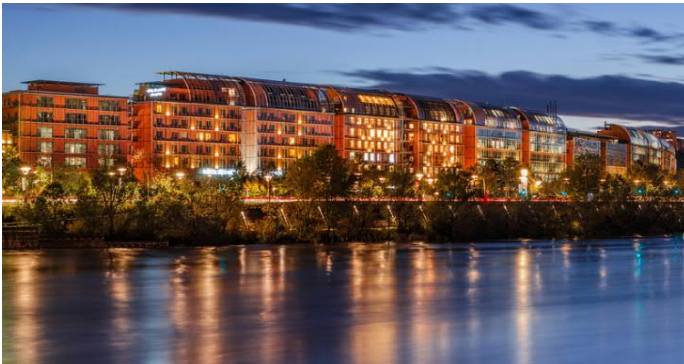
Рис. 1, 2. «Интернациональный город» арх. Р. Пиано, Лион, Франция, 1983–2006

В реальных проектах архитектурного постмодернизма рубежа 1980-х улица вновь акцентировала идею осознанного пути к цели в традиционном европейском городе. У Ренцо Пиано в его программном «Интернациональном городе» – протяженном квартале Лиона (Франция) – улица восстанавливает свое значение пути, ведущего к значимому общественному месту – большому Лионскому амфитеатру [Маевская, 2016, с. 24–25]. Обратное направление движения также приводит нас к архетипическому городскому про-