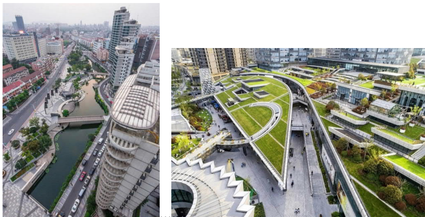
Рис. 8. Набережная в Чжанцзягане, 2015

в китайских, но и в международных СМИ и профессиональной прессе. Этот проект убедительно показывает, что создание новых привлекательных городских пространств в высокоурбанизированной среде наиболее успешно в новом веке именно тогда, когда в них сочетаются архетипические черты традиционной улицы (пути сквозь город), природные элементы, интегрированные в городское пространство на нескольких горизонтальных уровнях, и элементы современного благоустройства и дизайна, придающие дополнительную привлекательность таким городским фрагментам.